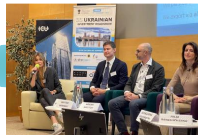
Ukrainian Investment Roadshow 2022