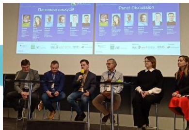
Міжнародна спеціалізована виставка EuroTier 2022 в м. Ганновер