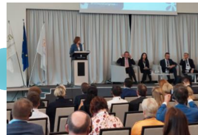
Пленарне засідання Конгресу європейських фермерів в м. Загреб