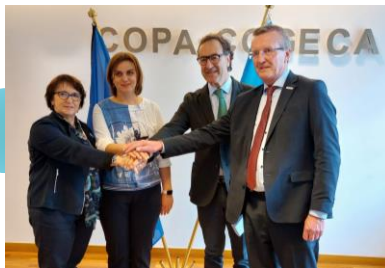
Зустріч з членами COPA COGECA в м. Брюссель