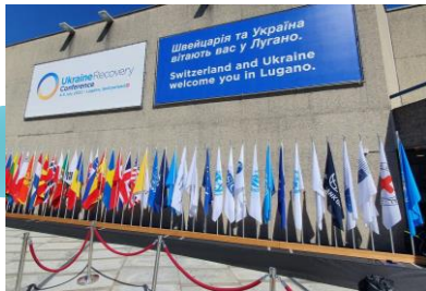
Конференція з питань відновлення України - Ukraine Recovery Conference в м. Лугано